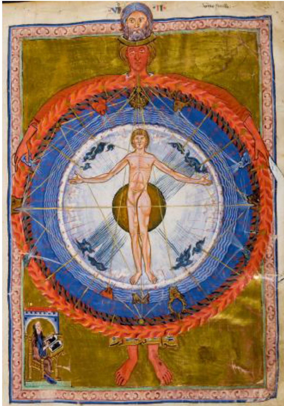
Hildegard von Bingen, „Der Kosmosmensch“